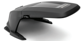
AUTOMOWER® ABDECKHAUBE 597 63 53-01