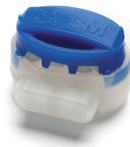
AUTOMOWER® KABELVERBINDER 501 98 02-01