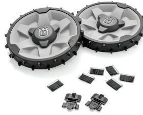
HINTERRAD-KIT 597 70 54-01