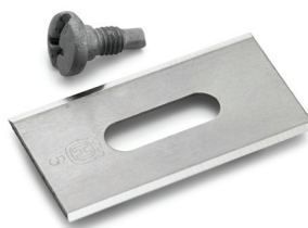
AUTOMOWER® MESSERSATZ ENDURANCE HSS 599 80 52-03