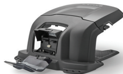
ABDECKHAUBE 585 01 94-01