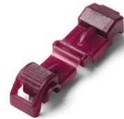
AUTOMOWER® KABELSTECKER 535 12 90-02