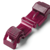
AUTOMOWER® KABELSTECKER 535 12 90-01