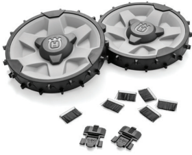
AUTOMOWER® HINTERRAD-KIT 536 84 92-01