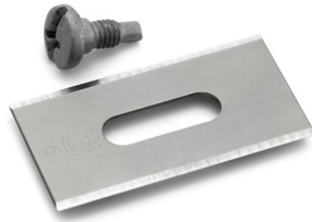
MESSERSATZ, ENDURANCE 595 08 44-03