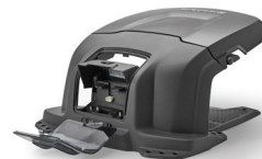
ABDECKHAUBE 587 23 61-01