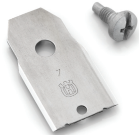
AUTOMOWER® MESSERSATZ ENHANCE HSS 599 80 53-01