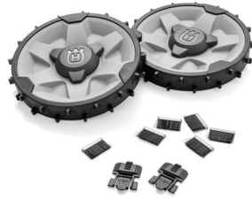
AUTOMOWER® HINTERRAD-KIT 581 88 97-02