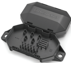
AUTOMOWER® ANSCHLUSS-BOX 599 80 17-01