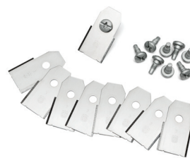
AUTOMOWER® MESSERSATZ, MESSER BEIDSEITIG GESCHLIFFEN 577 86 46-03