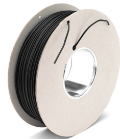
AUTOMOWER® BEGRENZUNGSKABEL 580 66 20-06