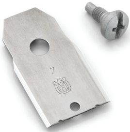
MESSERSATZ, ENHANCE HSS 599 80 53-02