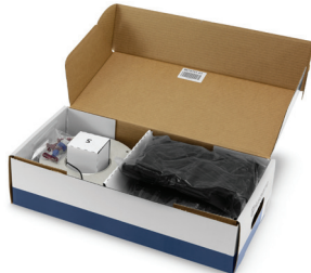
AUTOMOWER® INSTALLATIONS- KIT 967 97 21-01