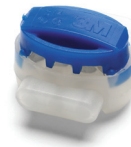
KABELVERBINDER 501 98 02-03