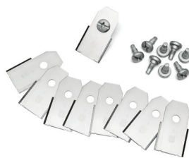
AUTOMOWER® MESSERSATZ CLASSIC 577 60 65-05