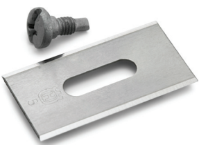
AUTOMOWER® MESSERSATZ ENDURANCE HSS 599 80 52-01