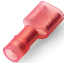
AUTOMOWER® KABELSTECKER 529 28 08-01