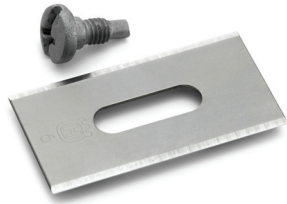
MESSERSATZ, ENDURANCE 595 08 44-02