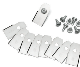
AUTOMOWER® MESSERSATZ CLASSIC 577 60 66-04