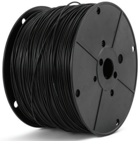
AUTOMOWER® BEGRENZUNGSKABEL 580 66 20-09