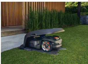
AUTOMOWER® ABDECKHAUBE 536 66 41-01