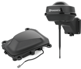
EPOS™ KIT 970 66 34-04