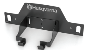
AUTOMOWER® WANDHALTERUNG 585 01 97-02