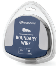
AUTOMOWER® BEGRENZUNGSKABEL 597 23 78-02