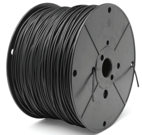
AUTOMOWER® BEGRENZUNGSKABEL HEAVY DUTY 522 91 41-02