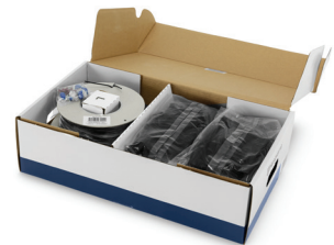
HUSQVARNA AUTOMOWER® INSTALLATION KIT 967 97 23-01