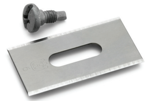
AUTOMOWER® MESSERSATZ ENDURANCE 595 08 44-01