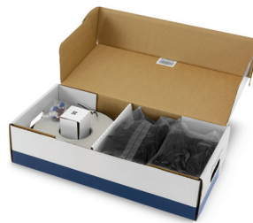
HUSQVARNA AUTOMOWER® INSTALLATION KIT 967 97 22-01