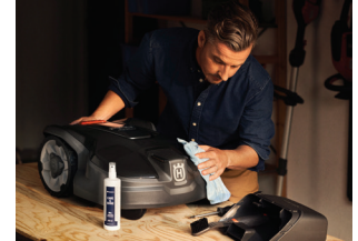
WARTUNGS- UND REINIGUNGSKIT 590 85 51-01