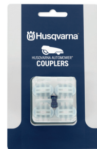
KABELVERBINDER 577 86 47-01