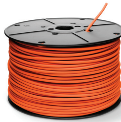
AUTOMOWER® BEGRENZUNGSKABEL PRO 593 29 77-02