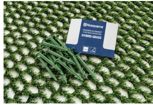
AUTOMOWER® HYBRID-KIT RASENNETZ 598 89 60-01