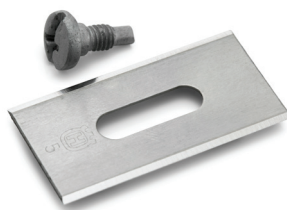
MESSERSATZ, ENDURANCE HSS 599 80 52-02