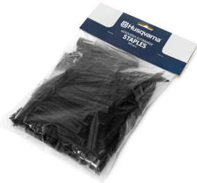
AUTOMOWER® BEFESTIGUNGSKLAMMERN 577 86 42-01