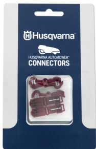
KABELSTECKER 577 86 48-01