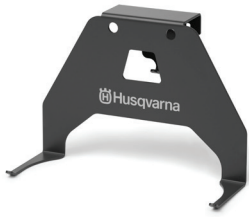
AUTOMOWER® WANDHALTERUNG 597 70 36-01