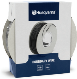
AUTOMOWER® BEGRENZUNGSKABEL 597 23 78-01